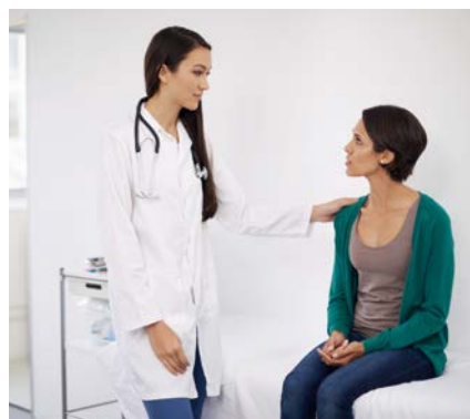
Abbildung 7: Aufklärung über Risiken

beziehungsweise den Arbeitgeber als Vertragspartner weiter. Vor einer direkten Weitergabe des Ergebnisses, beispielsweise mit der Beurteilung „geeignet“ oder „nicht geeignet“, an Arbeitgeber sollte dem Arzt beziehungsweise der Ärztin eine wirksame schriftliche Einwilligung der untersuchten Person vorliegen (§ 4a Bundesdatenschutzgesetz). Wirksam ist diese Einwilligung dann, wenn die Bewerberin beziehungsweise der Bewerber über die Art der Untersuchung, ihre Ziele und die möglichen Rechtsfolgen der Ergebnisweitergabe angemessen informiert wurde.