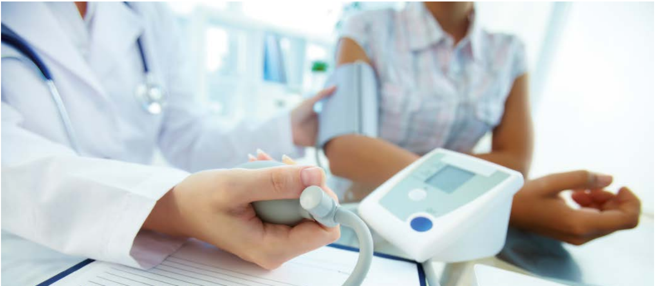
Abbildung 1: Nachweis der Erfüllung körperlicher Voraussetzungen

Vorsorge ist die Frage, inwiefern von der ausgeübten Tätigkeit eine Gefahr für die Gesundheit von Beschäftigten ausgeht. Zentrales Ziel der Neufassung der ArbMedVV ist die Stärkung des Rechtes der Beschäftigten auf informationelle Selbstbestimmung und Datenschutz. Das bedeutet, dass Beschäftigte grundsätzlich selbst darüber entscheiden, wann und innerhalb welcher Grenzen sie persönliche Sachverhalte offenbaren wollen.