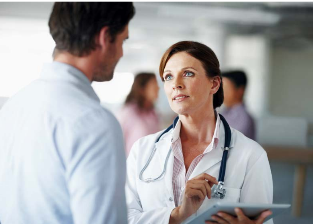
Abbildung 6: Die Schweigepflicht gilt auch gegenüber dem Unternehmen