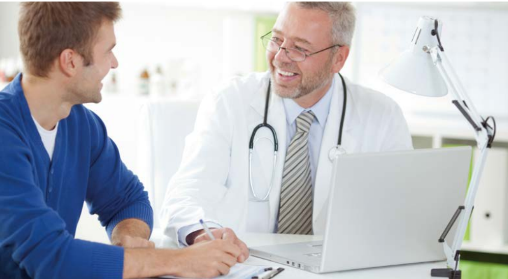
Abbildung 4: Beratungsgespräch als Kern der arbeitsmedizinischen Vorsorge