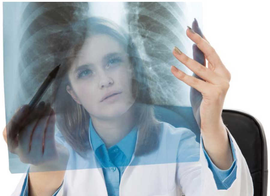
Abbildung 5: In bestimmten Fällen sind Eignungsuntersuchungen gesetzlich vorgeschrieben

Eignungsuntersuchungen bedürfen immer einer Rechtsgrundlage. Die arbeitsmedizinische Vorsorge umfasst gemäß § 2 Abs. 1 Nr. 5 ArbMedVV ausdrücklich nicht den Nachweis der gesundheitlichen Eignung für berufliche Anforderungen. Daher kann diese Verordnung nicht als Rechtsgrundlage für Eignungsuntersuchungen herangezogen werden. Nach aktueller Rechtsauffassung sind weder die DGUV Empfehlungen für arbeitsmedizinische Beratungen und Untersuchungen (zum Beispiel zu Fahr-, Steuer- und Überwachungstätigkeiten)