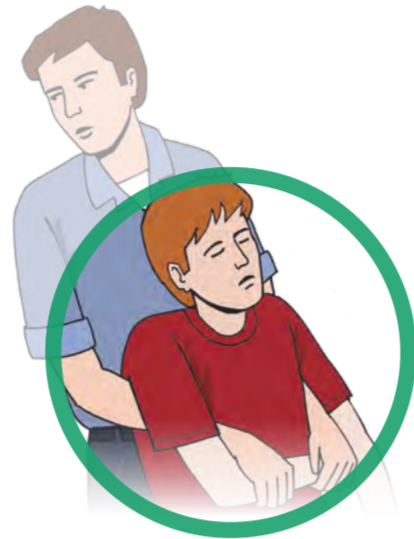
Person ggf. aus dem Gefahrenbereich retten