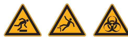
W007 Warnung vor Hindernissen am Boden W008 Warnung vor Absturzgefahr W009 Warnung vor Biogefährdung