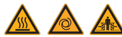
W017 Warnung vor heißer Oberfläche W018 Warnung vor automatischem Anlauf W019 Warnung vor Quetschgefahr