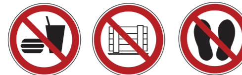
P022 Essen und Trinken verboten P023 Abstellen oder Lagern verboten P024 Betreten der Fläche verboten