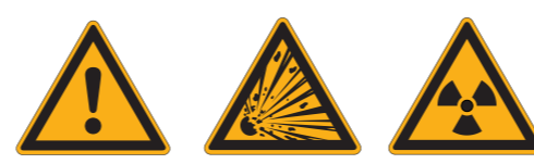
W001 Allgemeines Warnzeichen 8 W002 Warnung vor explosionsgefährlichen Stoffen W003 Warnung vor radioaktiven Stoffen oder ionisierender Strahlung