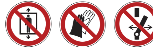
P027 Personenbeförderung verboten P028 Benutzen von Handschuhen verboten P031 Schalten verboten