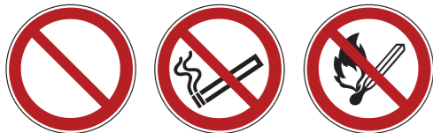
P001 Allgemeines Verbotsszeichen 1 P002 Rauchen verboten P003 Keine offene Flamme; Feuer; offene Zündquelle und Rauchen verboten