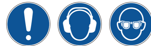
M001 Allgemeines Gebotszeichen 12 M003 Gehörschutz benutzen M004 Augenschutz benutzen