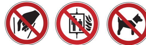
P015 Hineinfassen verboten P020 Aufzug im Brandfall nicht benutzen P021 Mitführen von Hunden verboten 4