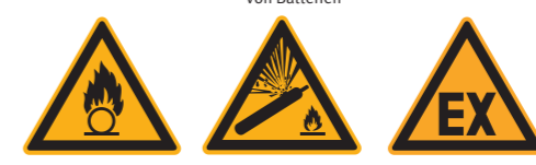
W028 Warnung vor brandfördernden Stoffen W029 Warnung vor Gasflaschen D-W021 Warnung vor explosionsfähiger Atmosphäre 10