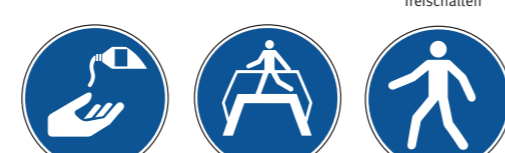
M022 Hautschutzmittel benutzen M023 Übergang benutzen M024 Fußgängerweg benutzen