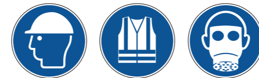
M014 Kopfschutz benutzen M015 Warnweste benutzen M017 Atemschutz benutzen