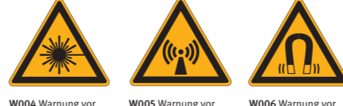
W004 Warnung vor Laserstrahl W005 Warnung vor nicht ionisierender Strahlung W006 Warnung vor magnetischem Feld