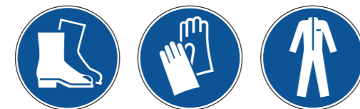
M008 Fußschutz benutzen M009 Handschutz benutzen M010 Schutzkleidung benutzen