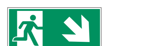
Beispiel für Notausgang (E002) mit Zusatzzeichen (Richtungspfeil)