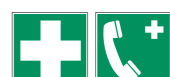
E003 Erste Hilfe E004 Notruftelefon