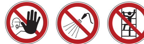
D-P006 Zutritt für Unbefugte verboten 5 P016 Mit Wasser spritzen verboten P009 Aufsteigen verboten 6