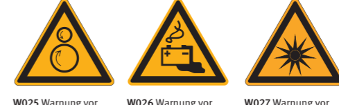
W025 Warnung vor gegenläufigen Rollen 9 W026 Warnung vor Gefahren durch das Aufladen von Batterien W027 Warnung vor optischer Strahlung