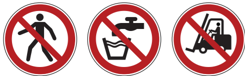
P004 Für Fußgänger verboten P005 Kein Trinkwasser P006 Für Flurförderzeuge verboten