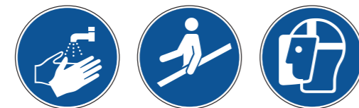
M011 Hände waschen M012 Handlauf benutzen M013 Gesichtsschutz benutzen