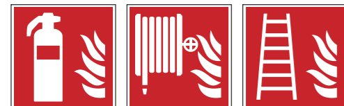
F001 Feuerlöscher F002 Löschschlauch F003 Feuerleiter