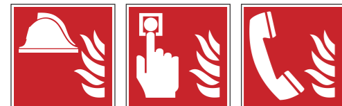
F004 Mittel und Geräte zur Brandbekämpfung F005 Brandmelder F006 Brandmelde-telefon