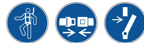
M018 Auffanggurt benutzen M020 Rückhaltesystem benutzen M021 Vor Wartung oder Reparatur freischalten