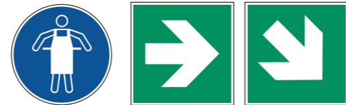
M026 Schutzschürze benutzen Richtungspfeile für Rettungszeichen sowie für Mittel und Einrichtungen zur Ersten Hilfe 13