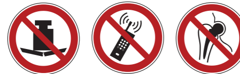
P012 Keine schwere Last 3 P013 Eingeschaltete Mobiltelefone verboten P014 Kein Zutritt für Personen mit Implantaten aus Metall