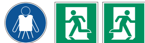
M053 Rettungsweste benutzen E001 Notausgang (links) 14 E002 Notausgang (rechts) 14