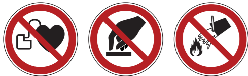
P007 Kein Zutritt für Personen mit Herzschrittmachern oder implantierten Defibrillatoren 2 P010 Berühren verboten P011 Mit Wasser löschen verboten