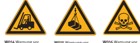
W014 Warnung vor Flurförderzeugen W015 Warnung vor schwebender Last W016 Warnung vor giftigen Stoffen