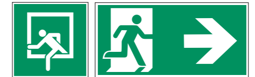
D-E019 Notausstieg 15 Beispiel für Notausgang (E002) mit Zusatzzeichen (Richtungspfeil)