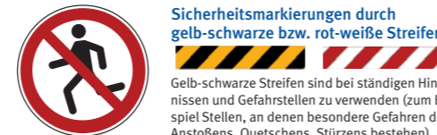
P048 Laufen verboten 7