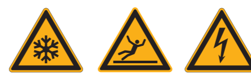
W010 Warnung vor niedriger Temperatur/Frost W011 Warnung vor Rutschgefahr W012 Warnung vor elektrischer Spannung