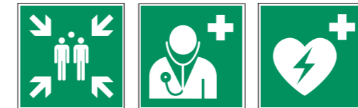
E007 Sammelstelle E009 Arzt E010 Automatisierter Externer Defibrillator (AED)