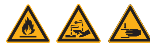
W021 Warnung vor feuergefährlichen Stoffen W023 Warnung vor ätzenden Stoffen W024 Warnung vor Handverletzungen