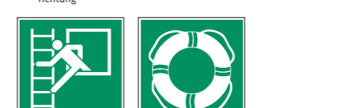
E016 Notausstieg mit Fluchtleiter E061 Wasser-Rettungs-ausrüstung 15