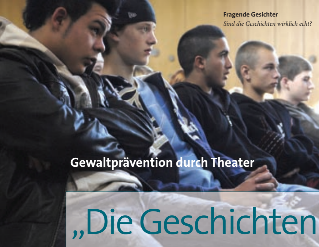
Fragende Gesichter Sind die Geschichten wirklich echt?