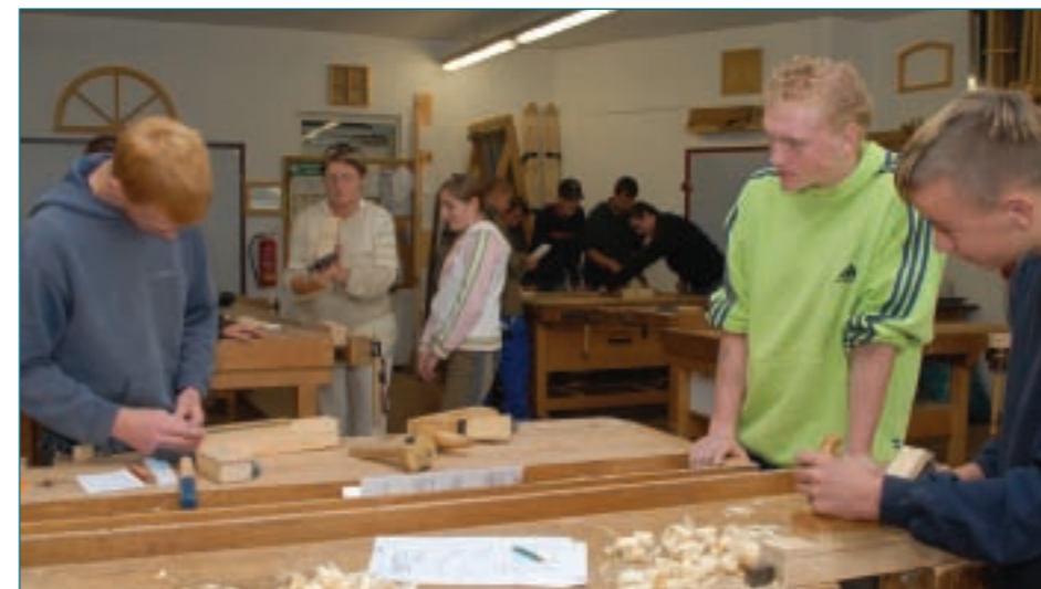
In der Holzwerkstatt des Kolping-Bildungszentrums Leipzig-Oschatz

Birte Müller-Heidelberg, redaktion@arbeit-und-gesundheit.de