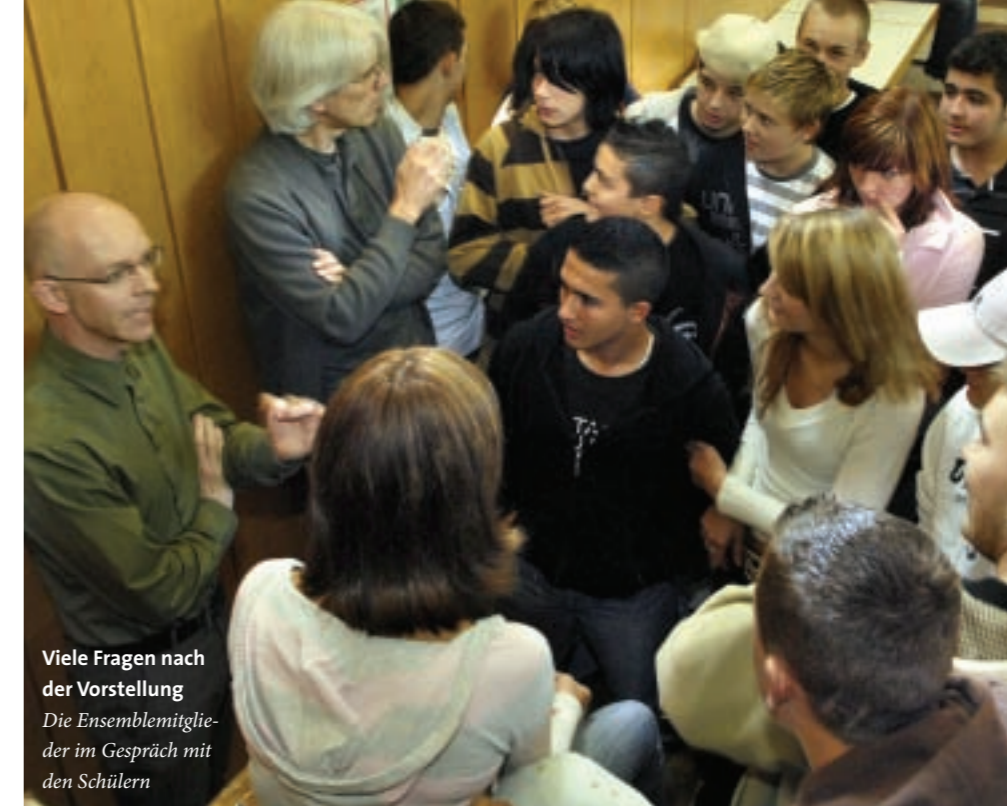
Viele Fragen nach der Vorstellung Die Ensemblemitglieder im Gespräch mit den Schülern

Wer erwartet, dass sich nach der „Enttarnung“ der Schauspieler eine große Enttäuschung breitmacht, wird erstaunt sein: Die Diskussionen gehen weiter, die Betroffenheit weicht nicht. Überall stehen Grüppchen von Jugendlichen, die miteinander reden, diskutieren. Die Botschaft ist angekommen, das Ziel erreicht: Gewalt ist ein Thema. Es wird darüber geredet und darüber nachgedacht.