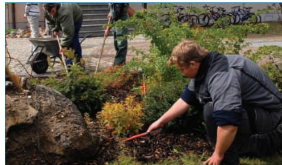
Praktische Übungen für angehende Landschaftsgärtner