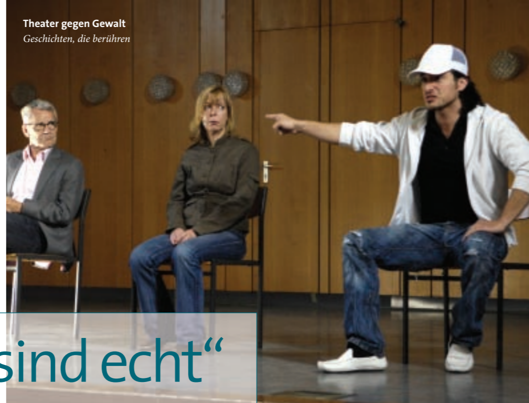
Theater gegen Gewalt Geschichten, die berühren

Was das Publikum nicht weiß: Alle sind Schauspieler, die Personen nicht real. Erst nach einer guten Stunde kommt die Auflösung: „Es war zwar Theater, aber die Geschichten sind alle echt. Sie haben sich so oder ähnlich in Deutschland abgespielt!“