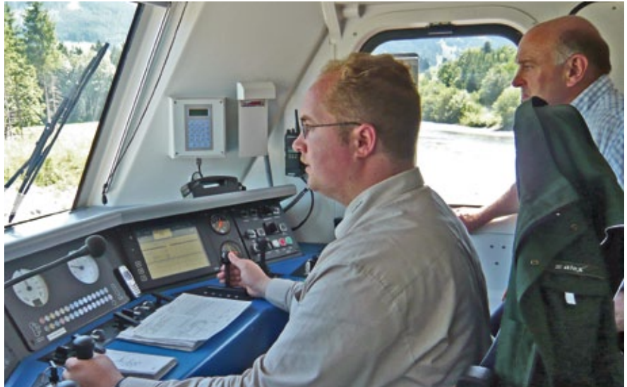
Eine Überwachung der Mitarbeiter ist auch bei vom Dienstort weit entfernt tätigen Mitarbeitern in angemessenem Umfang erforderlich.

überwacht werden. Bei großen Entfernungen zwischen Einsatz- und Dienstort ist dies keine leichte Aufgabe und bedarf meist eines erheblichen logistischen Aufwandes. Dieser Mehraufwand muss bei der Festlegung der Verantwortungsbereiche der einzelnen Vorgesetzten berücksichtigt werden. Dies liegt in der Organisationsverantwortung des Unternehmers.