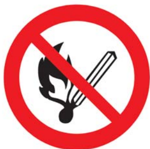
Verbotsschild P 02

Zeichen für explosionsgefährdete Bereiche: