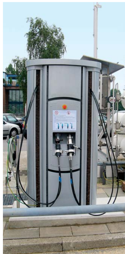
Diese Wasserstoff-Tankstelle für Pkw und Busse ist mit einem zentral angebrachtem NOT-AUS-Schalter ausgerüstet.

Wasserstoffbusse werden derzeit an Tankstellen mit einem Druck von 430 bar betankt. Unmittelbar nach der Betankung liegt der Druck fahrzeugseitig bei bis zu 380 bar. Nachdem der Tank etwa das Temperaturniveau der Umgebung erreicht hat, liegt der fahrzeugseitige Druck bei 350 bar.