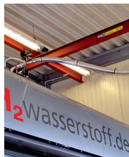
Bei einem Druckanstieg über 450 bar im System wird der Wasserstoff aus dem Fahrzeug über die Release-Leitung abgelassen.

Zur Detektion von Wasserstoff sind Sensoren erforderlich. Diese Sensoren sind im Deckenbereich der Werkstatt anzuordnen und sollen bei Auftreten einer Gaskonzentration optisch und akustisch warnen. Die Wasserstoffsensoren sollen bei spätestens 20 % der UEG einen Voralarm und beim zweifachen dieses Wertes den Hauptalarm auslösen. Die Sensorik an der Hallendecke kann jedoch nur große Leckagen erfassen, weil der Wasserstoff bei kleineren Leckagen sofort diffundiert und nur zu einem kaum messbaren Anstieg der Konzentration führt.