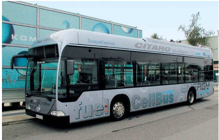
Dieses Serienfahrzeug ist mit moderner Brennstoffzellentechnik ausgestattet und wird im täglichen Fahrbetrieb erprobt.

Für die Speicherung des Wasserstoffes auf den Fahrzeugen sind zwei Varianten entwickelt worden. In beiden Fällen wird der Wasserstoff in Druckbehältern auf dem Dach der Fahrzeuge gespeichert.