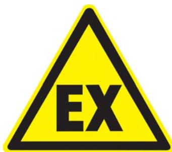
Warnschild W 21

nur noch Restwasserstoff in der Leitung vorhanden ist. Dieser kann aufgrund der niedrigen UEG noch zu einer Detonation führen. Daher muss auch hier mit mobilen Geräten überprüft werden, ob Leckagen am Fahrzeug vorhanden sind.