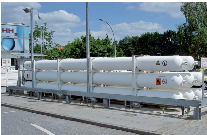
In den acht Speicherrohren wird das verdichtete Gas bei 430 bar vorgehalten. Wichtig ist hier ein Anfahrerschutz für Fahrzeuge.

Das Tragen von persönlicher Schutzausrüstung (PSA) mindert wirksam die Folgen von Unfallereignissen. Abhängig von der jeweiligen Werkstattsituation ist folgende PSA erforderlich: