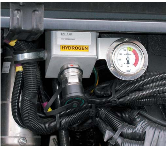
Wasserstoff erwärmt sich beim Tankvorgang. Nach kurzer Abkühlphase hat der Tank mit 350 bar seinen maximalen Betriebszustand erreicht.

geben werden. Dabei dürfen Komponenten des Fahrzeugs den abgeführten Wasserstoff nicht zünden können. LH 2 -Fahrzeuge ohne Boil-off-Management sind aufgrund dieser Konstruktion als betriebsmäßig undicht zu betrachten. Da an den Austrittsöffnungen dieser Fahrzeuge immer ein zündfähiges Gemisch entsteht, sind besondere Sicherheitsmaßnahmen in Werkstätten, Wartungs- und Abstellhallen erforderlich. Darüber hinaus verfügen diese Fahrzeuge über eine Reihe von Sensoren, die austretenden Wasserstoff feststellen und die Wasserstoffzufuhr dann sofort unterbrechen.