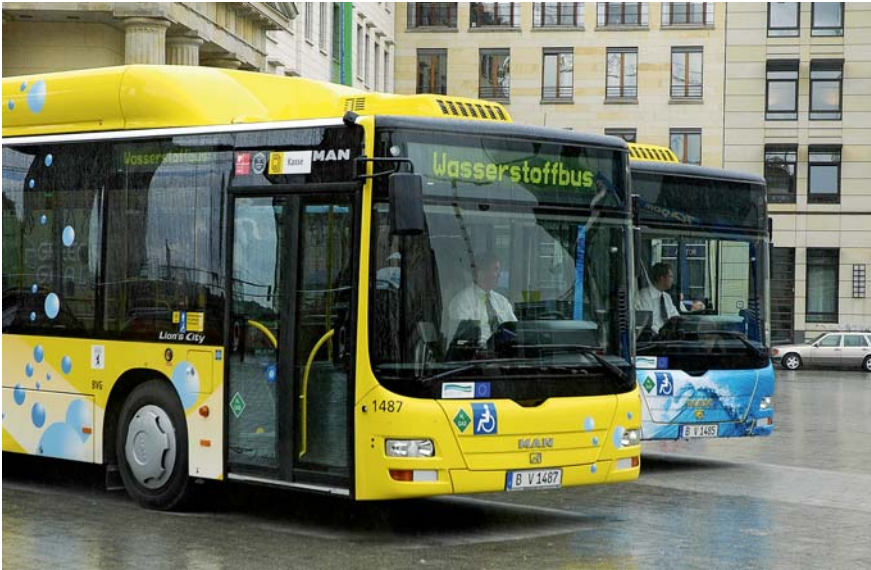
Wasserstoffbusse sind in Hamburg und Berlin schon Teil des Straßenbildes geworden. Die Fahrerinnen und Fahrer dieser Fahrzeuge sind besonders zu schulen.