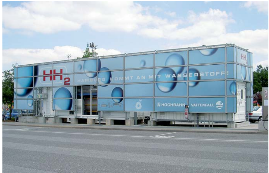
Diese Produktionsanlage für Druckwasserstoff steht auf dem Betriebshof Hummelsbüttel der Hamburger Hochbahn AG. Der Elektrolyseur produziert in 24 Stunden ca. den Tagesbedarf von drei Wasserstoffbussen.

Instandhaltungsarbeiten an den elektrischen Antrieben müssen vielfach zeitgleich mit anderen Arbeiten an mechanischen Komponenten durch-