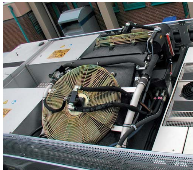
Aufgrund der auf dem Fahrzeugdach angeordneten technischen Ausrüstung ist bei einer Wagenwäsche die Dachbürste abzuschalten.