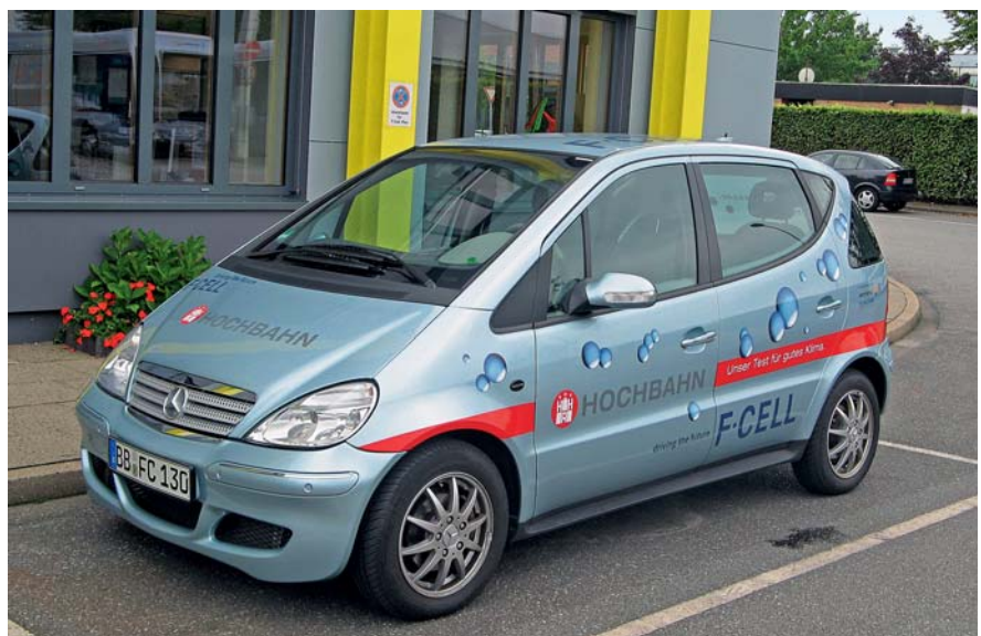
Auch mit Brennstoffzellen ausgestattete Pkw werden in Verkehrsunternehmen eingesetzt. Dies ist Chance und Herausforderung zugleich.

Bei den bereits durchgeführten und noch laufenden Projekten mit Wasserstofffahrzeugen hat sich gezeigt, dass diese Technologie auch im Linienbetrieb in Verkehrsunternehmen eingesetzt werden kann. Ein besonderes Augenmerk ist auf das Verhalten der Mitarbeiter zu richten, damit durch sicheren Umgang mit dieser Technologie schwere Schäden vermieden werden. Die Sicherheit beim Betrieb der Fahrzeuge und vor allem in der Instandhaltung ist ein wichtiger Faktor, um den positiven Ruf dieser Technologie auf Dauer zu gewährleisten.