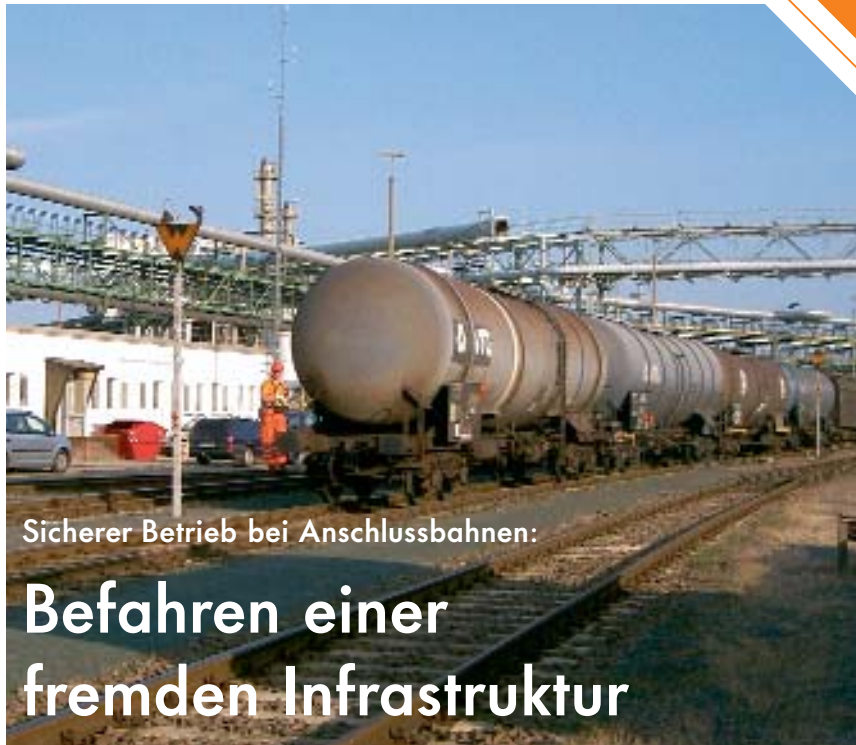
Sicherer Betrieb bei Anschlussbahnen:

In der Unfallverhütungsvorschrift »Schienenbahnen« (BGV D 30) wird gefordert, dass »für den Betrieb von Schienenbahnen Anweisungen zur Verhütung von Arbeitsunfällen aufzustellen und den Versicherten in geeigneter Weise bekanntzugeben« sind. Diese Forderungen werden bereits weitgehend abgedeckt, wenn das für den sicheren Eisenbahnbetrieb anzuwendende Verkehrsrecht stringent umgesetzt wird. Mit der vollständig überarbeiteten und erweiterten VDV-Schrift 750 »Dienstordnung der Anschlussbahn/Anweisung für den Eisenbahnbetriebsdienst; Bedienungsanweisung für die Anschlussbahn« steht dafür eine Handlungshilfe zur Verfügung, in der die Arbeitsschutzanforderungen als integraler Bestandteil eines sicheren Eisenbahnbetriebs berücksichtigt sind.