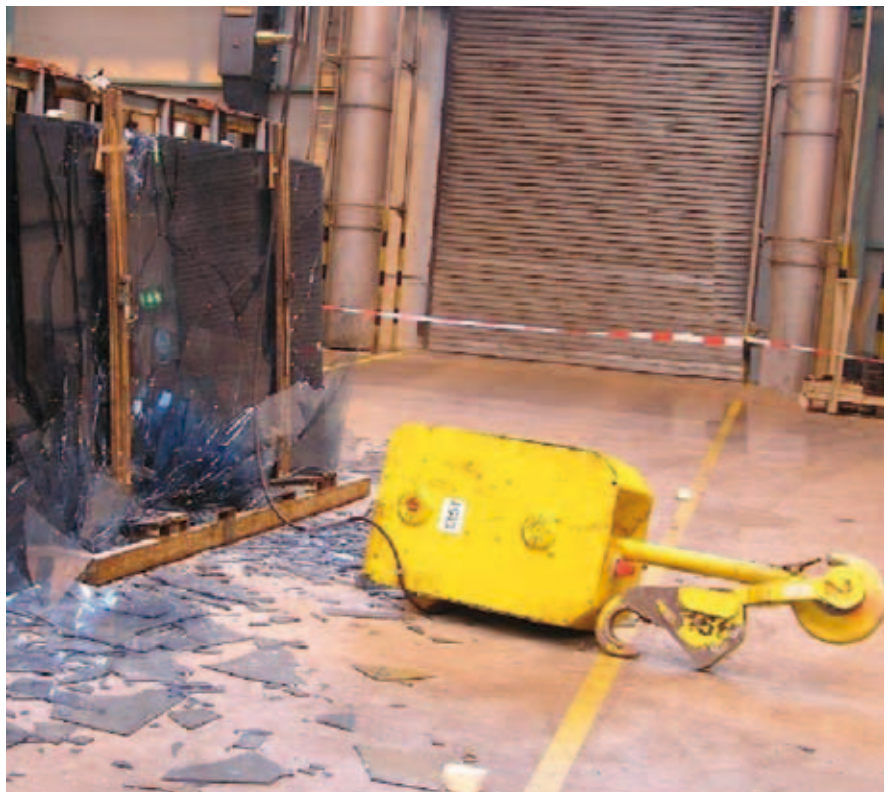
Abbildung 3: Lastenabsturz

Nach Ablauf der Gesamtnutzungsdauer sind Maßnahmen durchzuführen, bei denen nach Vorgabe des Herstellers Bauteile (Verschleißteile) geprüft und im Regelfall ausgetauscht werden.