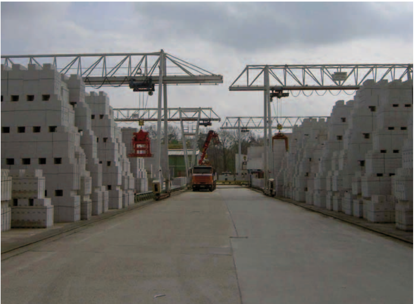
Abbildung 1: Portalkran

Winden als Seil- und Kettenzüge sowie Kranhubwerke als Teil von Maschinen oder Hebehilfen werden in vielen Unternehmen eingesetzt. Sie unterliegen regelmäßigen Prüfungen durch befähigte Personen nach TRBS 1203. Dabei ist immer das Ziel, das rechtzeitige Erkennen von Schäden, die zu einem Lastabsturz führen und dabei Personen gefährden, zu berücksichtigen. Die Ermittlung des