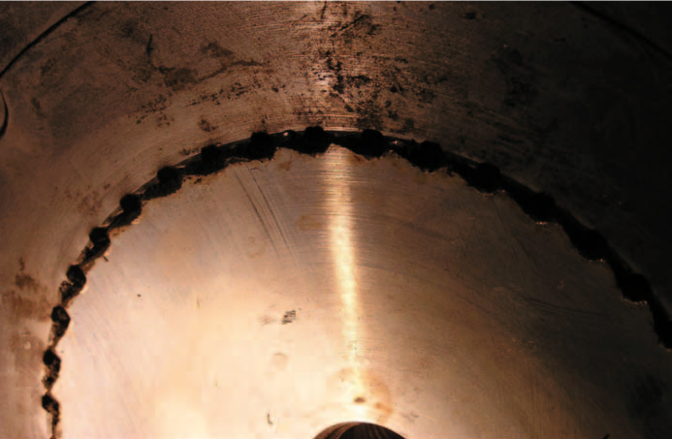
Abbildung 2: Getriebe eines Krans