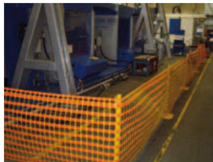
Abbildung 2: Einsatz von flexiblen Zäunen

In späteren Phasen des Probetriebes kann es notwendig sein, Probelaufe mit voller Arbeitsgeschwindigkeit zu fahren. Oft ist ein genaues Beobachten des Arbeitsprozesses erforderlich, was nicht vollständig von Standorten außerhalb des