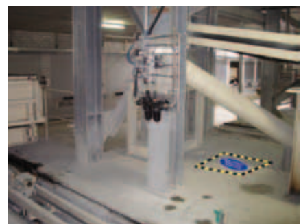
Abbildung 5: Beobachtungspunkt im Gefahrenbereich