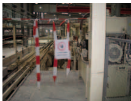
Abbildung 4: Kennzeichnung Bereichsende