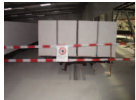
Abbildung 3: Einsatz von „Flatterband“ mit Warnhinweis