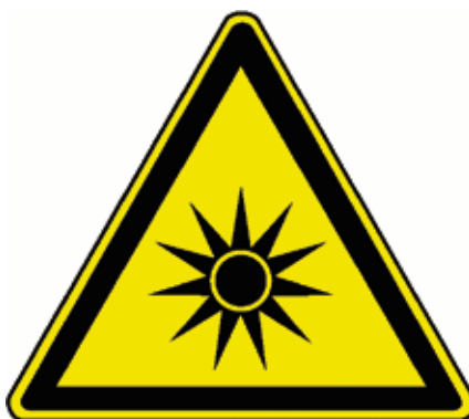
Abbildung 5: Warnung vor gefährlicher optischer Strahlung

Arbeitsplätze mit UV-Belastung müssen deutlich sichtbar gekennzeichnet sein. Dies kann durch das Zeichen „Warnung vor gefährlicher optischer Strahlung“ mit dem Zusatz „ultraviolette Strahlung“ geschehen.