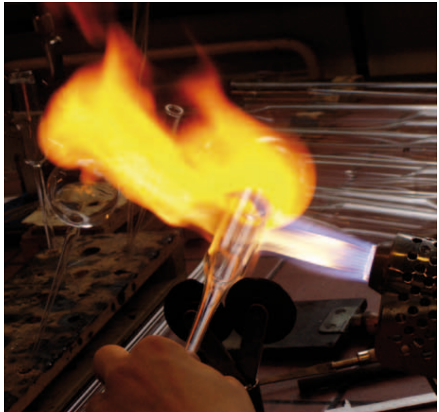
Abbildung 1: Bearbeitung von Glas an einem Tischbrenner

Die arbeitsbedingte Trübung der Augenlinse durch UV- und IR-Strahlung kann als Berufskrankheit (BK 2401) Anerkennung finden. Arbeitsbedingte Hautkrebs Erkrankungen durch UV-Strahlung werden bisher nur in Einzelfällen wie eine Berufskrankheit anerkannt.