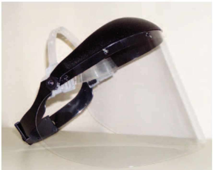
Abbildung 3: Kopfvvisier