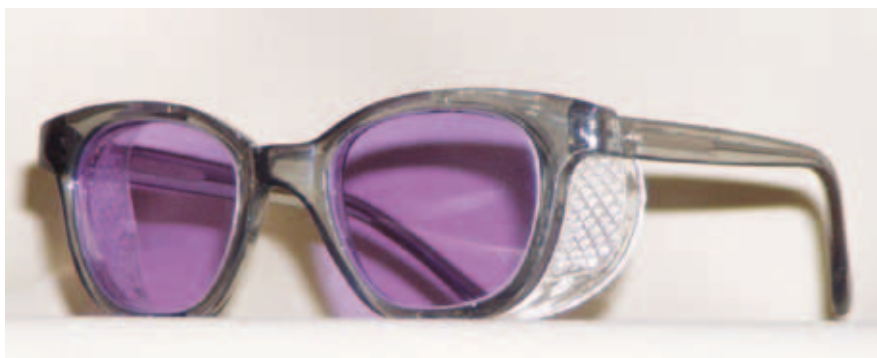
Abbildung 4: Schutzbrille

infraroter Strahlung schützen, sondern auch als Blendschutz vor starker sichtbarer Strahlung dienen. Kopfvvisiere haben gegenüber Brillen den Vorteil, dass sie nicht nur die Augen, sondern auch die Gesichtshaut schützen.