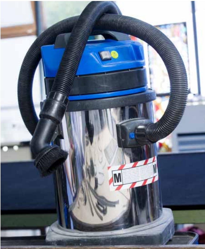
Abbildung 2: Staubsauger für bleihaltige Stäube (mindestens Kategorie M)

Der Fußboden sowie die Arbeitsflächen in Arbeitsräumen sollten glatt, fugenlos und leicht zu reinigen sein.