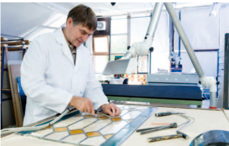
Abbildung 3: Belegung der Arbeitsflächen aus Holz mit Tetrapak-Folie oder Papier ermöglicht eine bessere Reinigung