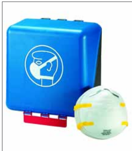
Abbildung 5: Korrekte Aufbewahrung der Staubmaske in einer Box in einem sauberen Bereich

Arbeitsplätze sind mindestens einmal pro Schicht, Arbeitsbereiche mindestens täg-