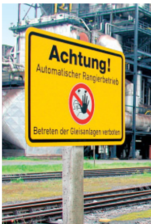
Abbildung 7: Besondere ortsbezogene Maßnahmen werden häufig durch Schilder an den Gefahrstellen deutlich gemacht.

Über besondere ortsbezogene Sicherheitsmaßnahmen werden Sie vom Verantwortlichen des Eisenbahnunternehmens vor Aufnahme Ihrer Tätigkeit informiert.