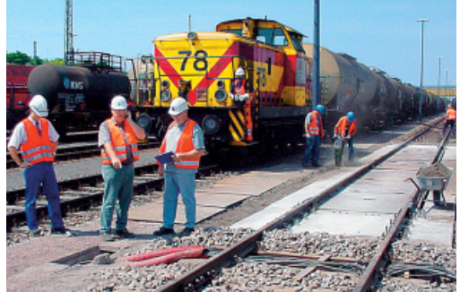
Abbildung 3: Beschäftigte, die sich im Gleisbereich besprechen, können nicht mit gleicher Aufmerksamkeit auf herannahende Fahrzeuge achten.