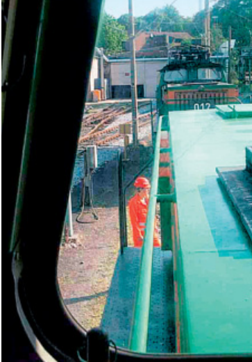
Abbildung 5: Der Lokführer kann vom Führerstand aus Personen nicht erkennen, die direkt vor dem Triebfahrzeug stehen.

beiden Seiten. Müssen Sie mehrere Gleise überqueren, so achten Sie an jedem Gleis erneut auf sich nähernde Schienenfahrzeuge.