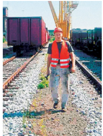
Abbildung 4: In Bahnanlagen gehen Sie stets auf den Randwegen.